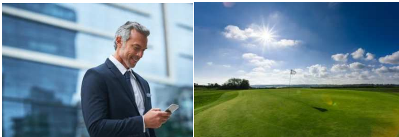
営業の外回りもゴルフのプレイ、男性も UV ケアが必須

アオモジ果実油やオレンジ果実油など 12 種類の精油*6をブレンドしたダマイオリジナルのオリエンタルアロマが、使う度深い安らぎをもたらします。心地良い伸びと使用感のウォータークリームテクスチャー、メイクを邪魔しない透明タイプで化粧下地としてもお使いいただけ、ベタつきが苦手な男性にもおすすめです。