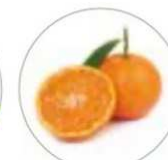
マンダリンオレンジ