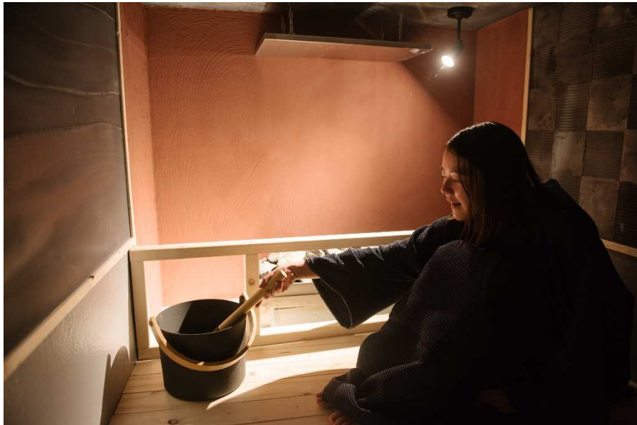
「SaunaLab Kanda」OKE エリア『からふる』というお一人様専用サウナにてセルフロウリュイメージ画像

「SaunaLab Kanda」では、ロウリュで使用できるさまざまなアロマのお試し提供、同店内のサウナマーケットにて販売を行っています。