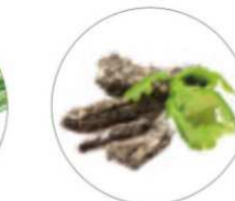
アミリスバルサミフェラ