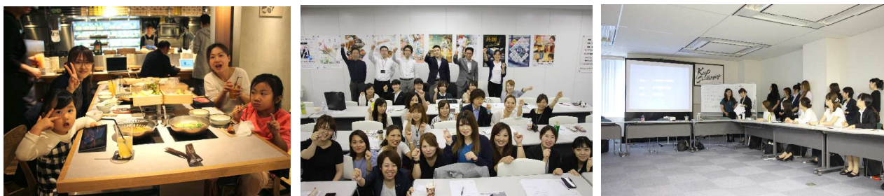
画像左から：お子様連れで懇親会に参加する社員、女性主体のプロジェクトを進めている会議の様子

女性キャリアアップシステムを整えたダイバーシティ課があります。結婚・出産によりライフスタイルが変化した後も、働き続けられる環境づくりに取り組んでいます。ダイバーシティ課の役職者は全員女性、またその多くが育児者です。2020年度は 女性社員比率 25% を目指した取り組みを計画しています。