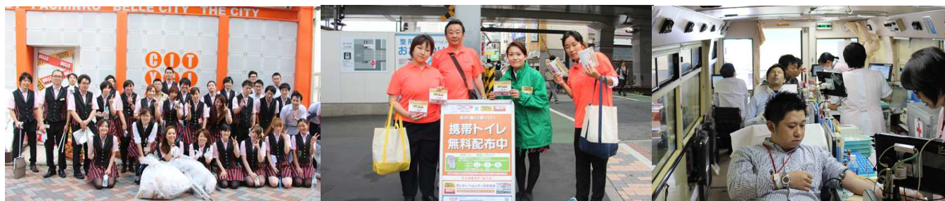
画像左から：『地域清掃活動』、『防災備蓄品の無料配布活動』、『献血活動』

※チョコをはじめとする文房具・事務用品の製造販売を行う企業。社員の70%以上が知的障がい者であり、障がい者雇用に力を入れていることでも知られています。