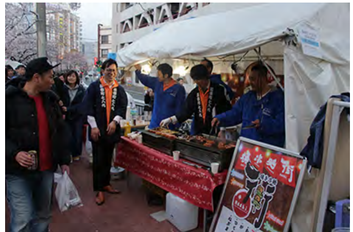
今年もたくさんの方々のお越しいただきました。