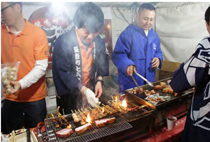
参加社員は各事業部から自発的に集まります。

毎年参加させていただいている「大岡川桜まつり」ですが、今年も当社に8つある事業部の垣根を越えて社員の交流を深め、また当社の創業の地である横浜・伊勢佐木地区の地域活性化に貢献していきたいと考え、参加させていただきました。これからも弊社では地域社会に貢献できるイベントに、積極的に参加していきたいと考えております。