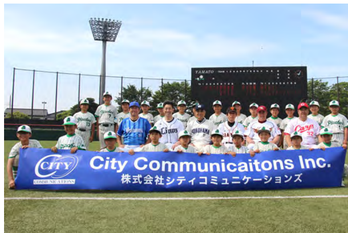
昨年の少年野球教室様子