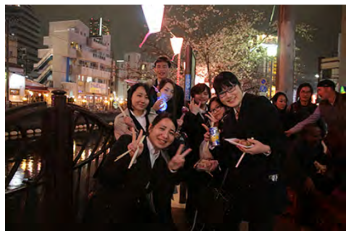
入社前研修を終えた新入社員も遊びに来ました。