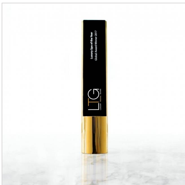
ラグジュアリートラベルガイド (L T G) グローバルアワード